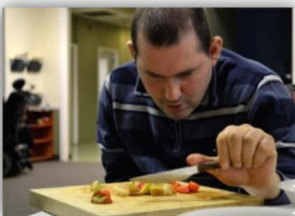
Santé et bien-être