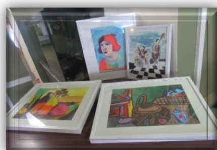
Art et créativité