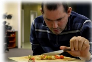
Cuisine et Nutrition