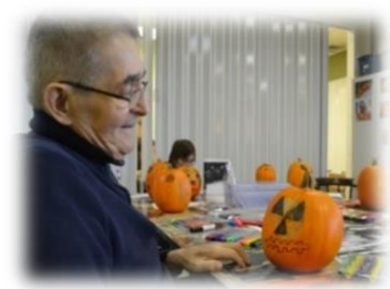
Arts et Créativité

Le programme de base du Centre Action est accompli grâce aux différents ateliers et activités qui constituent les quatre axes suivants :