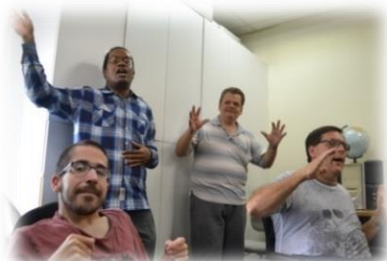
Santé et Bien-être

Vos dons aide à garantir que le Centre Action continuera à offrir son programme fondamental : promouvoir l'indépendance et réduire l'isolement, enseigner de nouvelles compétences assurant ainsi la proactivité et l'autosuffisance des membres, promouvoir le soutien mutuel, la confiance et l'acceptation, améliorer l'estime de soi, réduire le risque de dépression et offrir l'espoir d'un meilleur avenir.